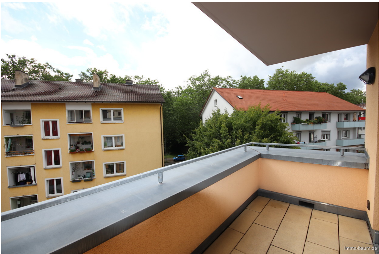
Blick von der Dachterrasse